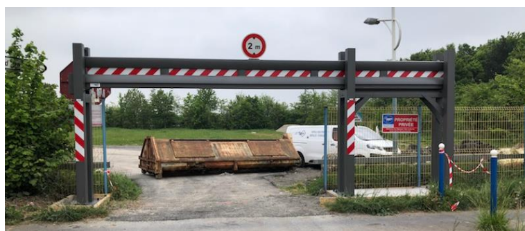
Version avec option double poutre renforcée ht 540 mm et poteaux de 150