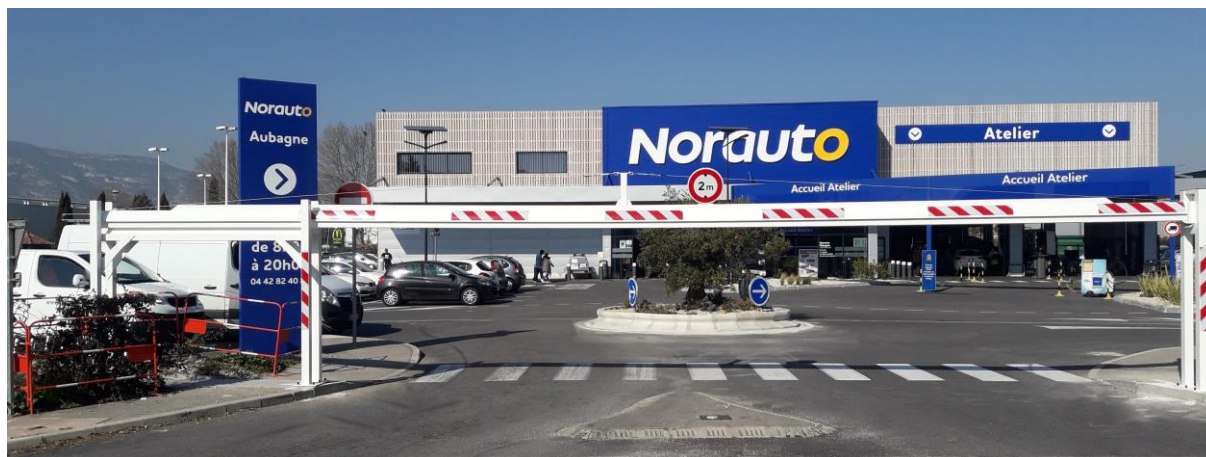
ULMAPARK 800 Manuel (lg max 10 560mm)

Les portiques manuels Ulmapark 800 offrent une solution pratique pour un bon filtrage des véhicules de plus de 2 m (poids lourds, caravanes...etc... ). Une variante en hauteur 1.10 m peut être utilisée comme poutre de barrage.