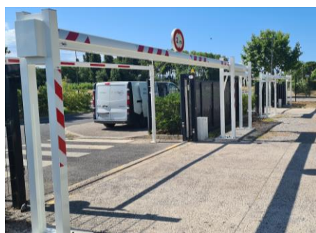
Version standard poutre simple 230 mm